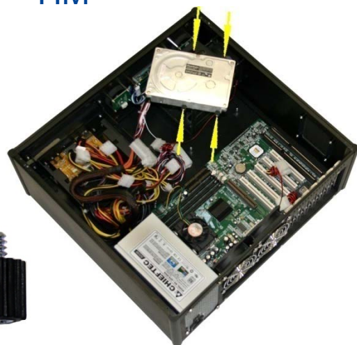
Abb.1 HDD Schraube

Die im Lieferumfang enthaltenen, schwarz gummierten, HDD Schrauben (Abb.1) werden seitlich an der Festplatte verschraubt (siehe markierte Stellen).