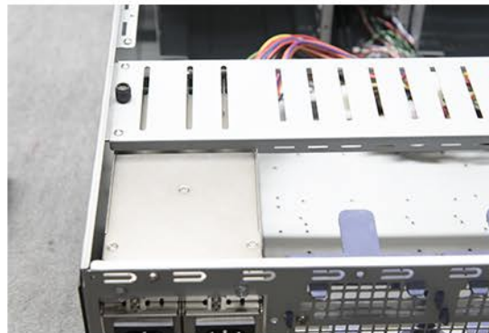
11. Montieren Sie den Festplattenkäfig aus Abb. 3.