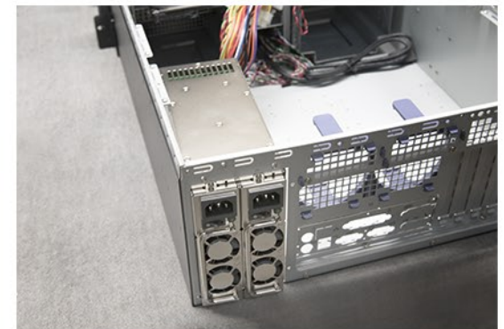
6. Platzieren Sie das Netzteil wie abgebildet.