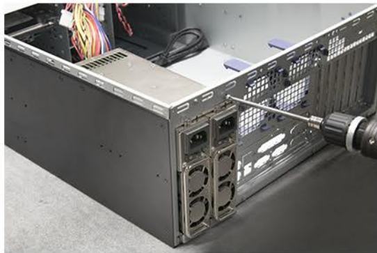
7. Das Netzteil wird jetzt mit fünf Schrauben montiert.