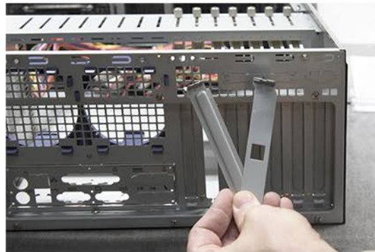
8. Tauschen Sie die PCI Blende gegen die Blende des Buzzer-Reset Tasters.