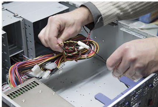
10. Verbinden Sie den Buzzer Taster mit dem Netzteil.