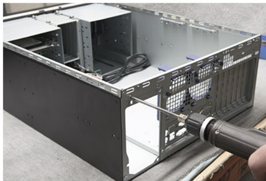
4. Lösen Sie die Schrauben der Netzteilblende.