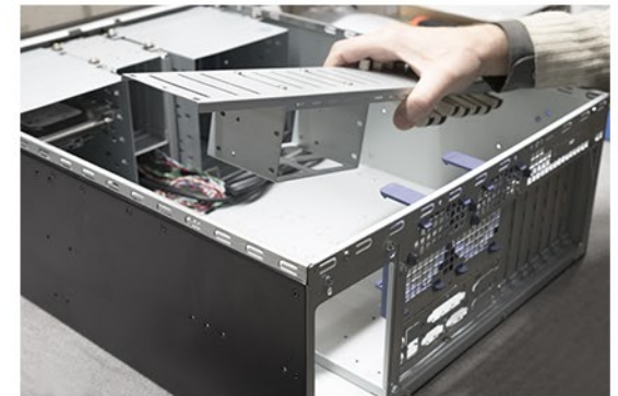
3. Demontieren Sie den HDD Käfig.