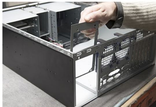
5. Entnehmen Sie die Netzteilblende. (Diese wird nur für ein reguläres ATX Netzteil benötigt)