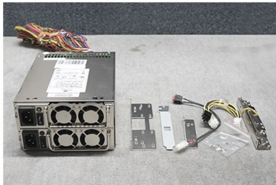
1. Übersicht des gesamten Zubehörs zur Montage des Mini-Redundanten Netzteils in das UNC-411E-B.